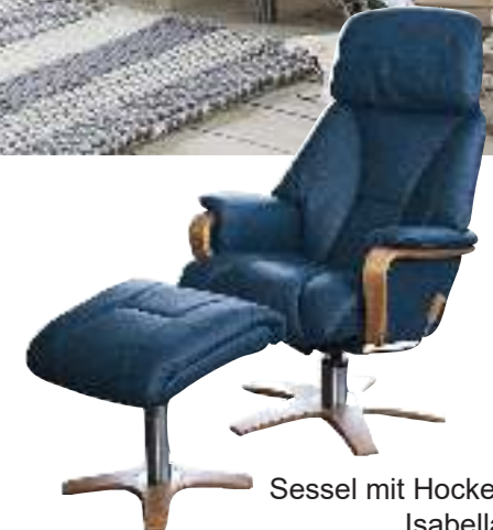
Sessel mit Hocker Isabella