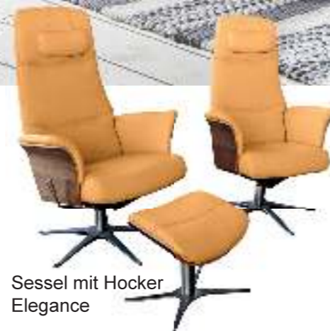
Sessel mit Hocker Elegance